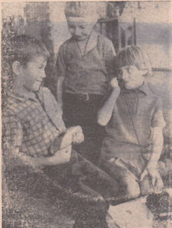
В ОБЪЕКТИВЕ—ДЕТИ. В детском саду поселка Новый.